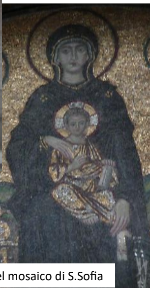
Chiesa di S. Irene (esterno e interno) e Maria Madre di Dio nel mosaico di S. Sofia

www.parrochiadicermenate.it - e-mail: info@parrochiadicermenate.it tel.: Parroco 031/77.18.12 Oratorio 031/97.21.364; 031/56.21.575